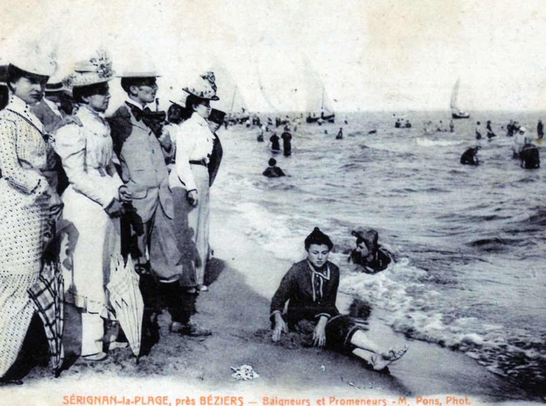
SÉRIGNAN-la-PLAGE, près BÉZIERS — Baigneurs, et Promeneurs

Sérignan/Valras-Plage, une histoire et un destin communs