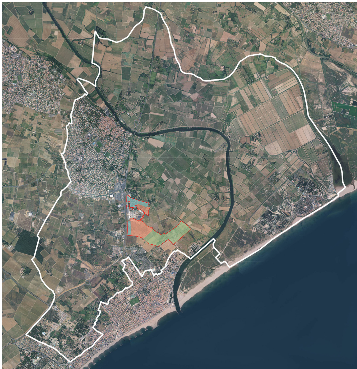
illustration 2. Localisation du projet au sein de la commune

Le secteur Jasse Neuve s'inscrit en limite sud-est de la ville, en continuité du tissu urbain.