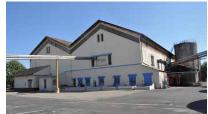
Cave coopérative datant de 1935

La vendange issue de notre terroir est vinifiée avec savoir faire dans la plus stricte tradition. Les cépages sont vinifiés séparément. Les vins ainsi produits sont élevés en chais avant leur mise en bouteille, une fois atteint la plénitude de leurs arômes. De nombreuses distinctions nationales et internationales témoignent de cette qualité.